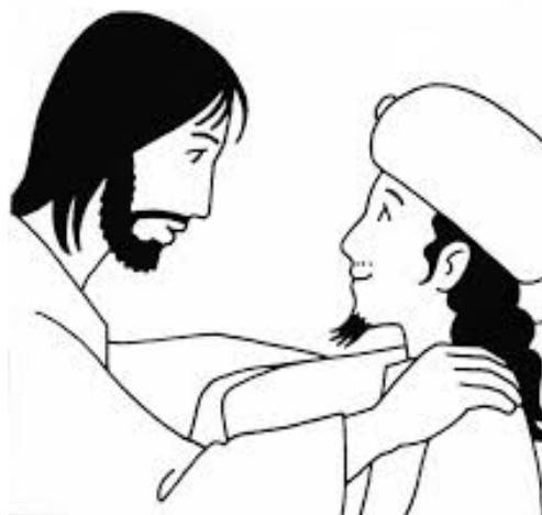
Gesù e il giovane ricco